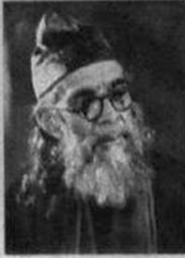
خواجہ حسن نظامی (شخصیت اور ادبی خدمات)